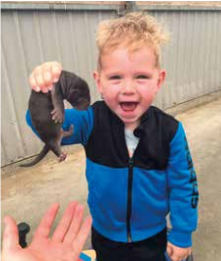
Winnende foto van de fotowedstrijd.

een pelzenwedstrijd, waarbij ook 3 prijzen werden uitgereikt.