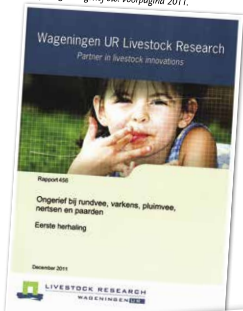
Wageningen ongerief etc. voorpagina 2011.

Op de argumenten "democratische marktwerking" en "de nertsenhouderij houdt van zelf op te bestaan wanneer de consument geen bont meer koopt" durven tegenstanders begrijpelijkerwijs niet te vertrouwen. Deze maand nog publiceerde de internationale bonthandel indrukwekkende cijfers. Maar liefst 60% van alle ontwerpers wereldwijd (o.a. grootheden als Fendi, Burberry, Louis Vuitton, Coach, Dolce en Gabbana, Marni en Giorgio Armani) hebben voor winter 2016 echt bont opgenomen in hun collecties. Ook een groot deel van de Nederlandse ontwerpers blijft niet achter! 1 op de 3 damesmodespecialzaken verkoopt in